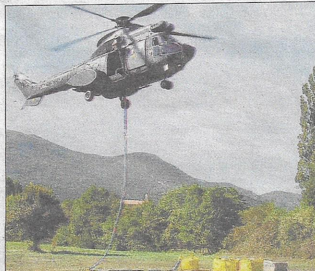
J.-R. T. Le super Puma enlève son chargement.

La tour du Riable se détache maintenant sur l'horizon au-dessus du village, une pièce du patrimoine revalorisée, bien qu'il reste encore quelques années de travail à accomplir. Tout comme ND de Calma, elle fait partie des atouts touristiques de Lachau. Le parcours de randonnée pédestre qui permet d'aller la visiter est accessible même aux randonneurs inexpérimentés. Le chemin qui y mène enchante tout autant les botanistes que les amateurs de papillons et d'oiseaux et, en haut, quelle belle vue panoramique !